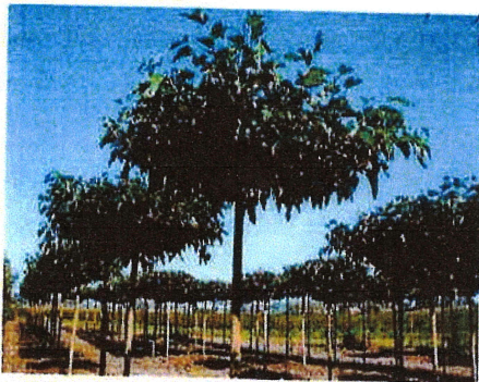
Murve bez ploda